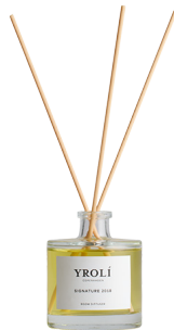
ROOM DIFFUSER signaturduft 2018

Plejende og genopbyggende. 99,4% naturlig, 88,4% økologisk.