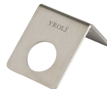
VÆGOPHÆNG Børstet rustfrit stål

Rene æteriske olier fra geranium, citrus, rosmarin og vanilje.